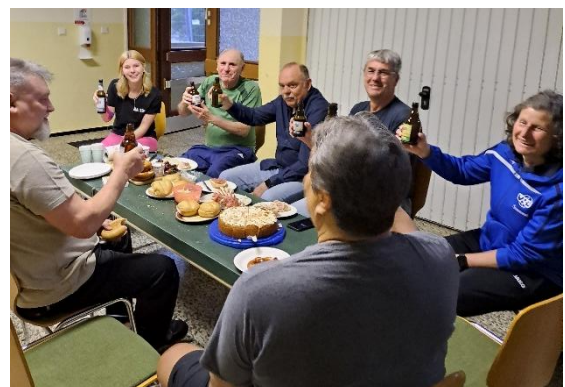
Die reichgedeckte Ela-Tafel

Danke an den Verein für diese einfach ideale Lokation.