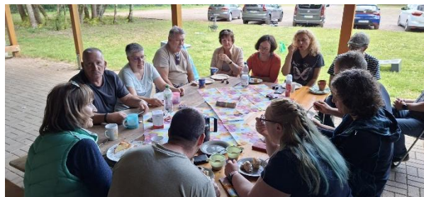
Familientag bei bestem Wetter

Unser nächstes Event steht bereits in den Startlöchern: