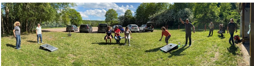
Cornhole = Spaß für die ganze Gruppe

Das 4. Hobby-Beachvolleyball – Turnier 2026 am 27. Juni