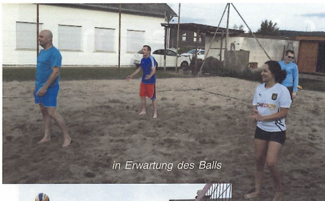
in Erwartung des Balls