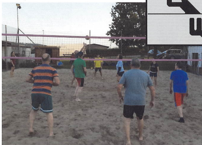
ein voller Platz