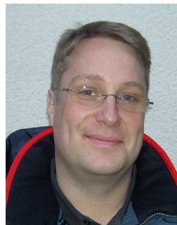
Referat Homepage Franz Reischauer